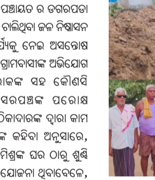
ସମୟରେ ବାହାରୁଥିବା ମାଟିକୁ ରାତିରେ ବିକ୍ରି କରାଯାଉଥିବା ନେଇ ଗ୍ରାମବାସୀ ଗୁରୁତର ଅଭିଯୋଗ ଆଣିଛନ୍ତି। ଯଦି ଏହି ଅଭିଯୋଗ ସତ୍ୟ ପ୍ରମାଣିତ ହୁଏ, ତେବେ ଏହା ସରକାରୀ ସମ୍ପତ୍ତିର ଅପବ୍ୟବହାରର ଗମ୍ଭୀର ଘଟଣା ହେବ। ସବୁଠାରୁ ଚିନ୍ତାଜନକ ବିଷୟ ହେଉଛି, କାମ ଚାଲିଥିବା ବେଳେ ଗ୍ରାମକୁ ଜଳ ଯୋଗାଣ କରୁଥିବା ପାଣି