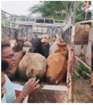
ସମୟରେ କସିଆ ସାମୁଦ୍ରିକ ପୋଲିସ ଗାଡ଼ିକୁ ଗୋଡ଼ାଇ ଥିଲେ ଏବଂ ଅଟକାଇ ଥିଲେ। ଏହି ବୋହେଇ ପିକଅପ ଭ୍ୟାନ୍ ର ଡ୍ରାଇଭର ଏବଂ ଚାକ ଅମାନୁଷିକ ଭାବରେ ବାନ୍ଧି ନେଇଥିବା

ବାସୁଦେବପୁର, ୨୧।୬ : ଭଦ୍ରକ ଜିଲ୍ଲା ବାସୁଦେବପୁର ବ୍ଲକ ଅନ୍ତର୍ଗତ ଚୁଡ଼ାମଣି ଆଡିଆ ରେ ଏକ ପିକଅପ ଭ୍ୟାନ୍ ରେ ୧୧ଟି ଗୋ ବଂଶ ମାନଙ୍କୁ ଅତି ନିର୍ମମ ଅମାନୁଷିକ ଭାବରେ ଗୋଡ଼ୁ ପୁଅକୁ ବାନ୍ଧି ରାତିରେ ଚୋରା ଚାଲାଣ କରୁଥିବା ସମୟରେ ପୋଲିସ ହାତରେ ଧରା ପଡ଼ିଥିଲା। ସୂଚନା ଅନୁଯାୟୀ ଗୋ ସେବକଙ୍କ ଠାରୁ ଖବର ପାଇ କସିଆ ସାମୁଦ୍ରିକ ପୋଲିସ, ଚୁଡ଼ାମଣି ସାମୁଦ୍ରିକ ପୋଲିସ ଏବଂ ଗୋସେବକ, ବଜରଙ୍ଗ ଦଳର କାର୍ଯ୍ୟକର୍ତ୍ତା ମାନଙ୍କ ମିଳିତ ଭାବରେ ଚଢ଼ାଉ କରାଯାଇଥିଲା। ଶେଷରେ ଗୋ ବଂଶ ବୋହେଇ ପିକଅପ ଭ୍ୟାନ୍ ଯାହାର ଗାଡ଼ି ନମ୍ବର ଓଡି ୦୧ ଏ ୬୮୮୬ ରେ ଅତି ଅମାନୁଷିକ ଭାବରେ ବାନ୍ଧି ନେଇଥିବା